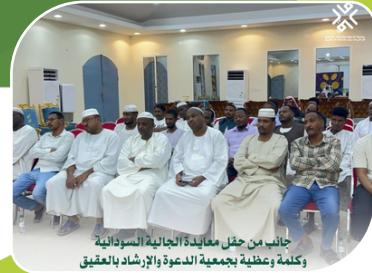
جانب من حفل معايدة الجالية السعودية وكلمة وعظيمة بجمعية الدعوة والإرشاد بالعقيق